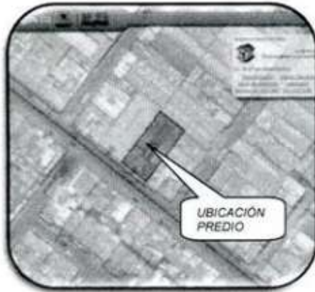
LOCALIZACIÓN PREDIO SINUPOT